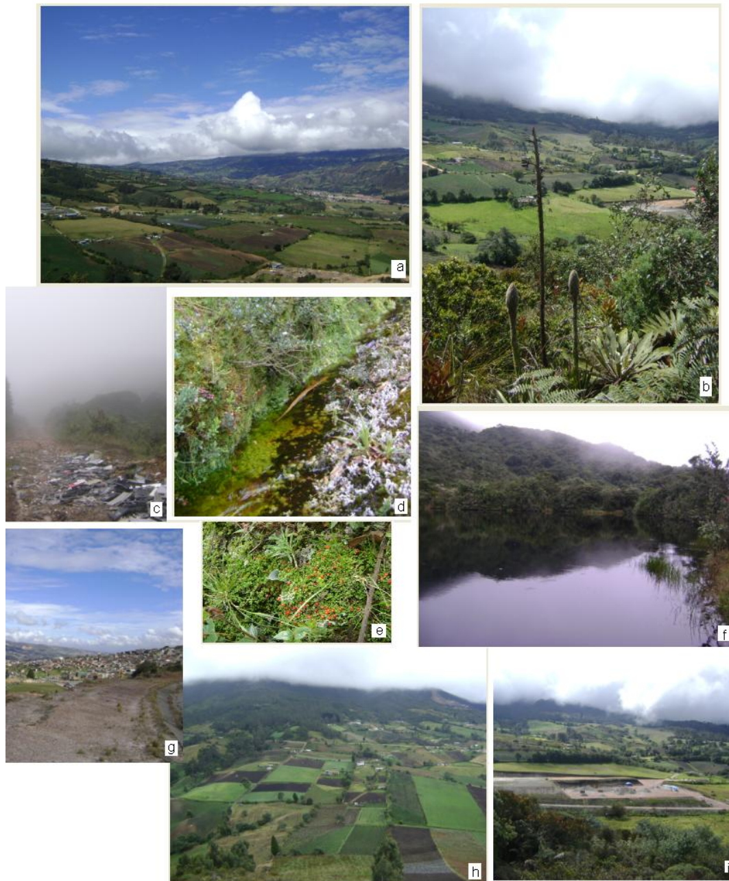
Figura 1. Recorrido por el Agroparque 'Los Soches' (Abril 20 de 2013). Identificación del área: Ecosistemas, Sistemas productivos y problemáticas ambientales.